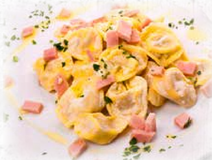
TORTELLINI ALLA PANNA